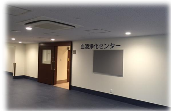
血液浄化センター

また、病院ということもあり、近隣の透析施設からの入院透析の依頼に対しても積極的に受け入れをし、地域医療にも貢献していくことを目標としています。