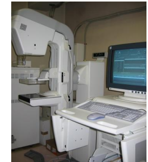
(マンモグラフィ装置)