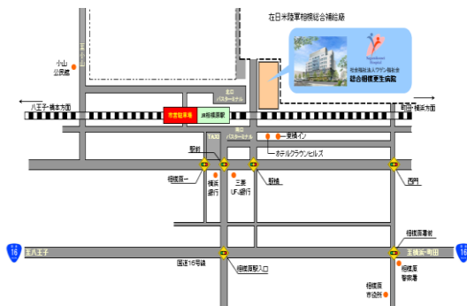
JR横浜線 相模原駅 徒歩1分